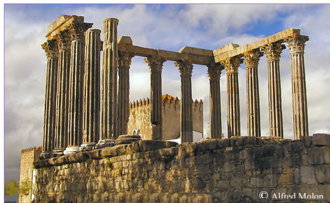
Templo de Diana

Sendo uma cidade relativamente compacta, está internamente bem servida de uma rede rodoviária de transporte público amiga do ambiente , constituindo-se também como um importante 'hub' na rede de ligações rodoviárias e ferroviárias, nacionais e internacionais.